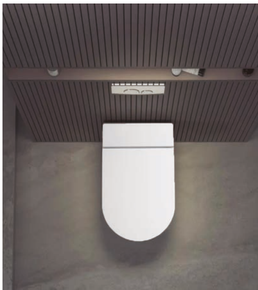
Exclusivo del dormitorio principal W220 Inodoro suspendido blanco con bastidor vogospain.com