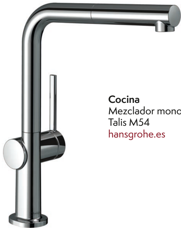
Cocina Mezclador monomando Talis M54 hansgrohe.es