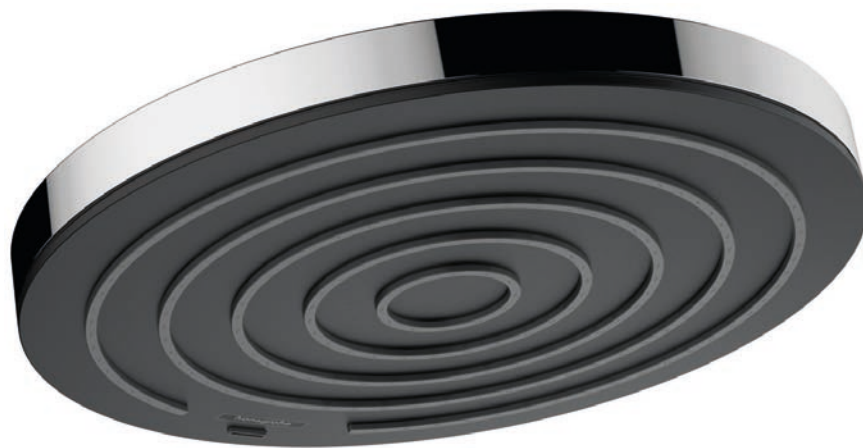
Baño principal Ducha fija Pulsify S hansgrohe.es