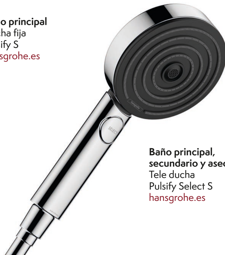
Baño principal, secundario y aseo Tele ducha Pulsify Select S hansgrohe.es