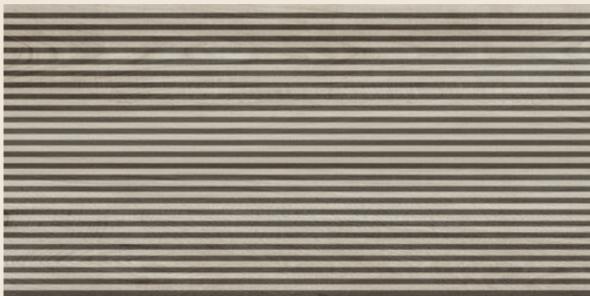
Decoración baño suite y 2 60 x 120 Ergón Foresta Faggio baldocer.com