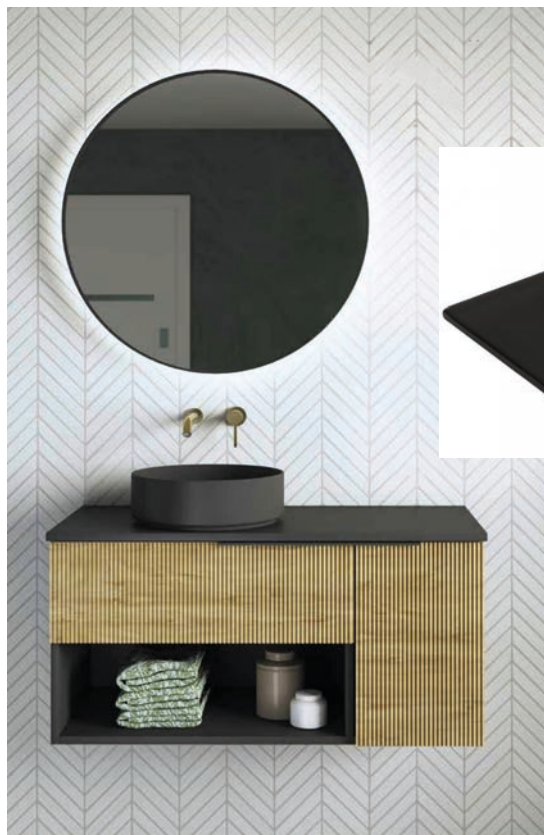
Baño 2 planta alta: Mueble modelo Manila, color roble ostippo, con lavabo de porcelana desplazado, Vancouver negro de 80 cm, con tirador negro y espejo redondo, de 80 cm iluminado.