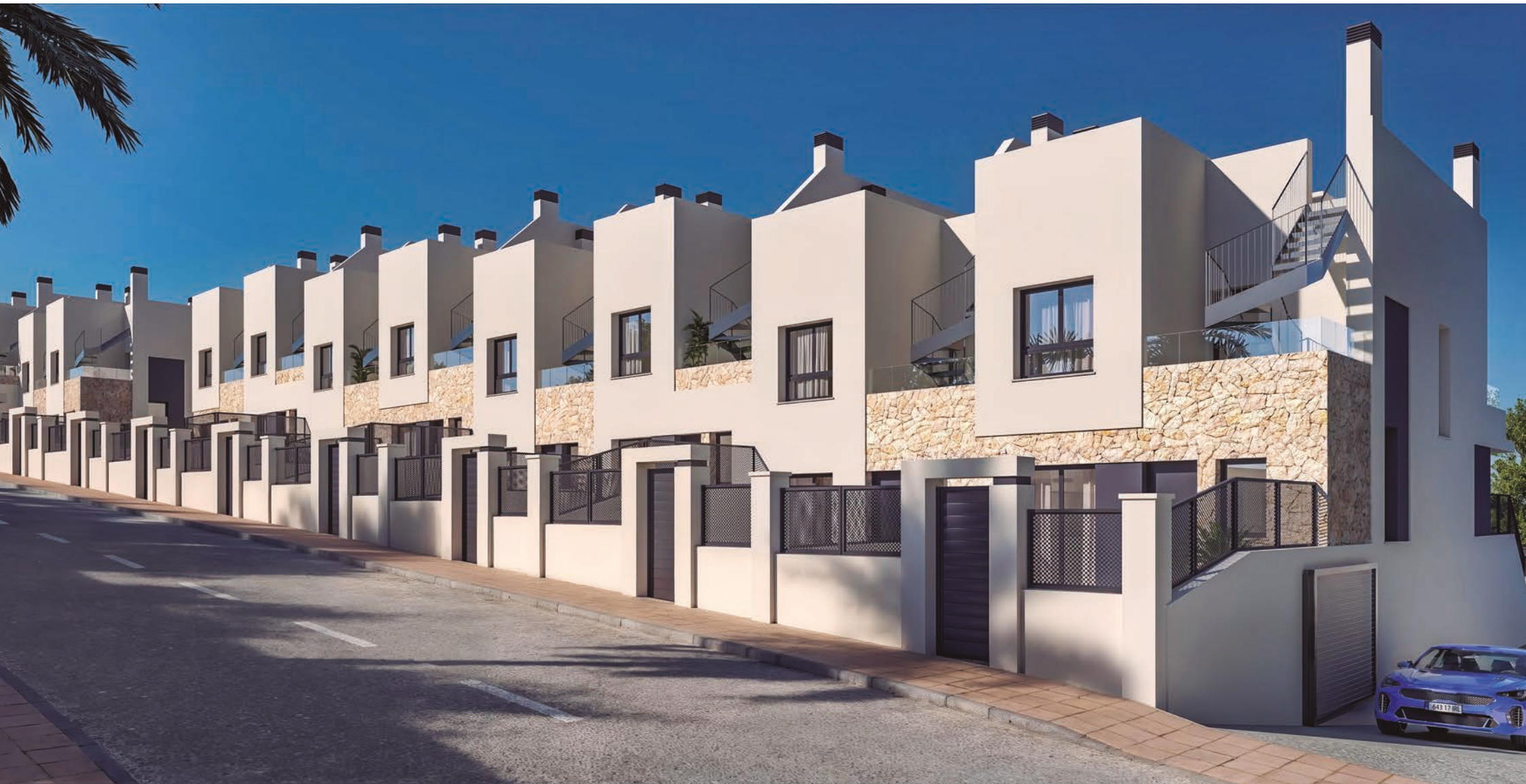
Enfoscado de mortero y pintura especial para exterior