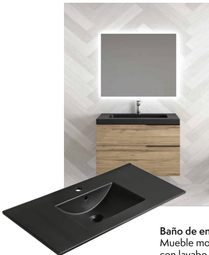
Baño de entrada y de sótano: Mueble modelo Tahití, color olmo sabi, con lavabo de porcelana Vancouver negro de 60 cm, con tirador negro y espejo iluminado.