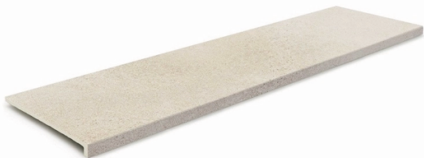
Peldaños interiores 33 x 120 Stromboli Light/Cream ceramicamayor.com