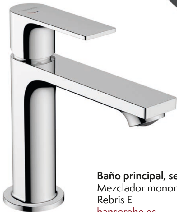
Baño principal, secundario y aseo Mezclador monomando de lavabo Rebris E hansgrohe.es