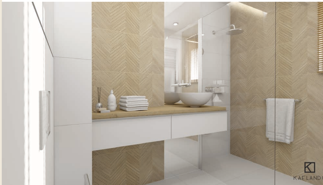
Decoración aseo 60 x 120 Zig Larchwodd IPE baldocer.com