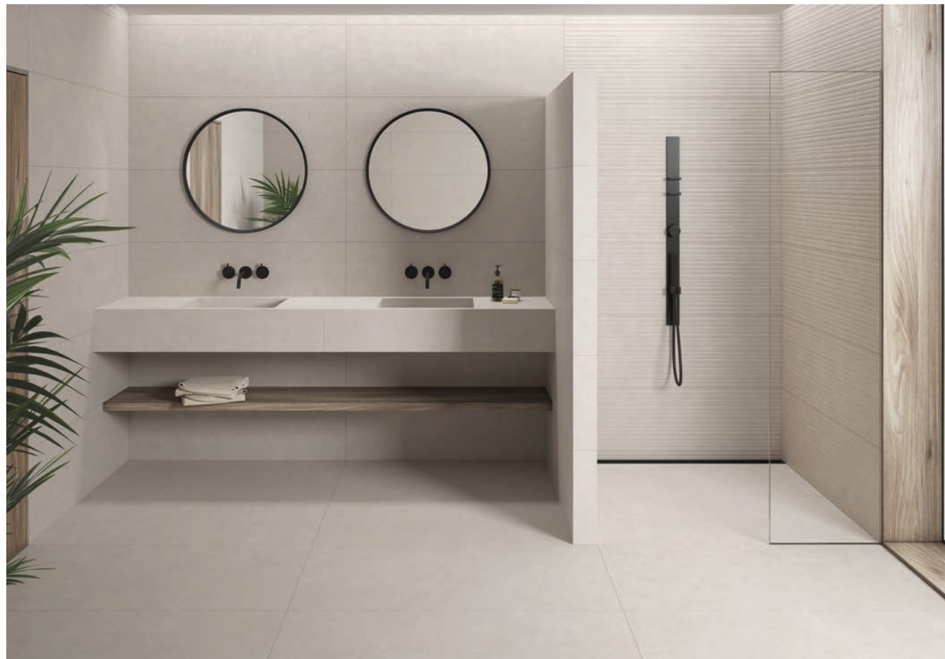
Revestimiento general 60 x 120 Concept Natural N/R azuvi.com