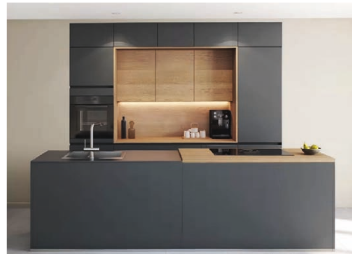
Color mobiliario cocina